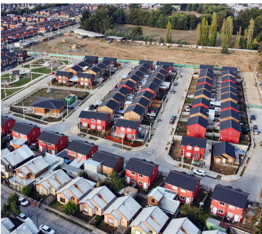
En villa Padre Luis de Valdivia II, dirigentes alertaron del robo de un vehículo, que apareció posteriormente desmantelado.

También sugieren no dejar objetos de valor a la vista dentro de los automóviles y reportar cualquier actividad sospechosa a Carabineros de inmediato.