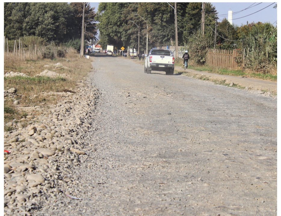
Parece “campo”, pero la avenida Estación es una de las más transitadas de Labranza, y no posee proyectos de pavimento.